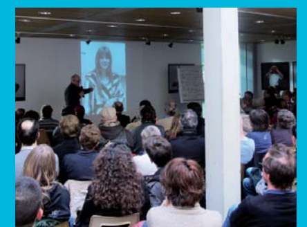
Afin d'accueillir un public de plus en plus nombreux, les conférences musicales sont désormais proposées dans la salle d'exposition