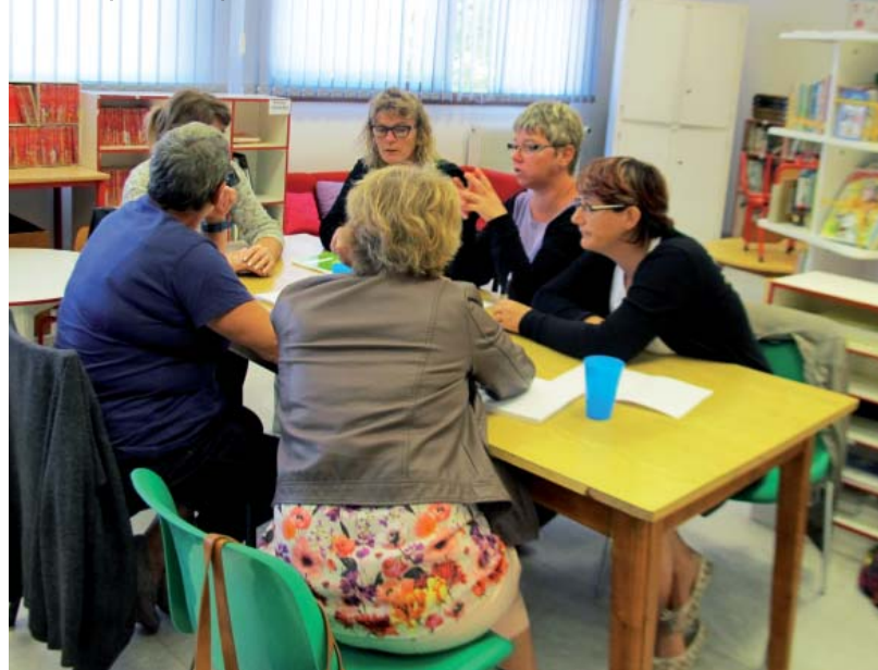
Durant l'été, des agents ont suivi une formation sur la prise en charge de l'enfant pendant la pause méridienne.

et d'un animateur pour dix-huit enfants pour les plus de 6 ans.