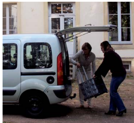
Une navette quotidienne entre les deux médiathèques permet d'offrir un accès à toutes les collections.