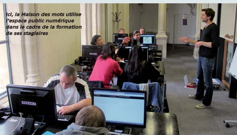
Ici, la Maison des mots utilise l'espace public numérique dans le cadre de la formation de ses stagiaires