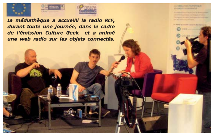
La médiathèque a accueilli la radio RCF, durant toute une journée, dans le cadre de l'émission Culture Geek et a animé une web radio sur les objets connectés.

Avec la fusion intercommunale, la médiathèque de Trun est devenue un équipement d'Argentan Intercom le 1 er janvier 2014. Ouverte dans un bâtiment neuf depuis juin 2014, elle était jusqu'alors gérée par des bénévoles de l'association "Bibliothèque pour tous". Argentan Intercom a souhaité créer un réseau de médiathèques afin d'offrir un service de lecture publique de qualité et égal en termes de collections et d'animations sur l'ensemble de son territoire. Toute l'année 2015 a consisté à inventorier, désherber et compléter les fonds notamment de CD et de DVD de la médiathèque de Trun. Depuis le 1 er septembre, les deux médiathèques fonctionnent en réseau. Tout abonnement souscrit est valable dans les deux équipements.