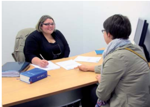
Une juriste de l'ADIL assure les permanences à la Maison des Entreprises et des Territoires

L'ADIL a pour mission d'informer les usagers sur tous les aspects juridiques, financiers et fiscaux liés au logement : information sur le domaine locatif (état des lieux, dépôt de garantie, préavis...), copropriété, information sur le domaine fiscal (revenus fonciers, taxes diverses...), information sur le lotissement, copropriété, contrat, compromis, simulation de plan de financement (prêt à taux 0%, CEL, PEL...).