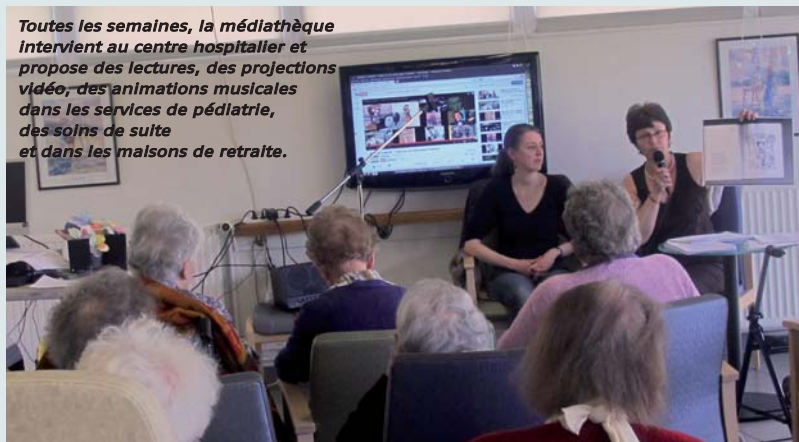
Toutes les semaines, la médiathèque intervient au centre hospitalier et propose des lectures, des projections vidéo, des animations musicales dans les services de pédiatrie, des soins de suite et dans les maisons de retraite.