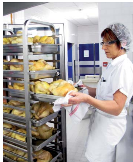
Près de 140 poulets bio, originaires de La Cochère, seront nécessaires à la préparation des quelque 1000 repas servis.

◆ Du 12 au 16 octobre, la cuisine centrale participe à la 26 e semaine du goût. Créée à l'initiative du journaliste gastronomique Jean-Luc Petitrenaud, cette manifestation contribue à faire découvrir au plus grand nombre la diversité des aliments et des saveurs qui ornent nos assiettes. L'équipe de restauration collective s'associe à cet événement et propose, à chaque nouvelle édition, des thèmes et des menus différents. "Pour cette année, la tendance est aux arômes, explique Nadège Leraud, responsable de la cuisine centrale. "Nous avons souhaité privilégier des produits aux saveurs très marquées et de saison", poursuit-elle. Ainsi, myrtille, menthe, basilique, curry, noix,... agrémenteront les plats servis aux enfants dans les écoles du territoire intercommunal. Sur les quatre repas inscrits au menu de la semaine, un sera totalement bio. "La semaine du goût est un événement qui nous permet d'aller encore plus loin dans notre volonté d'éduquer les enfants dès leur plus jeune âge aux saveurs et à la gastronomie", conclut la responsable.