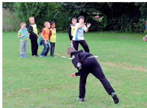
Découverte de la thèque, activité d'origine normande similaire au baseball.

> Renseignements Ligue de l'enseignement 06.61.73.19.72