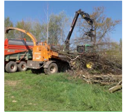
DÉVELOPPEMENT DURABLE Transition énergétique