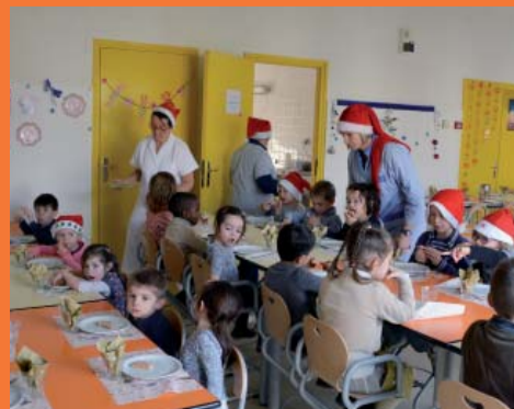
À l'école Jean de la Fontaine, une attention particulière est accordée à la décoration de la cantine.