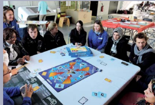
Dans le cadre des assises nationales du numérique auxquelles participait la médiathèque d'Argentan, un groupe de stagiaires de la maison des mots s'est rendu au colloque sur la pratique et la prévention à l'usage des réseaux sociaux.

Centre de formation spécialisé dans les compétences clés, la maison des mots intervient auprès de publics faiblement qualifiés. L'objectif de sa mission est, par une requalification autour de l'écrit, l'oral, les mathématiques, le numérique ou la mobilité, de délivrer les savoirs nécessaires à la base d'une activité professionnelle. Les profils des stagiaires sont variés. Ils concernent