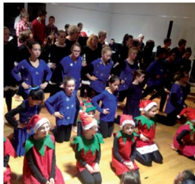
CONSERVATOIRE Un projet qui donne le "la"