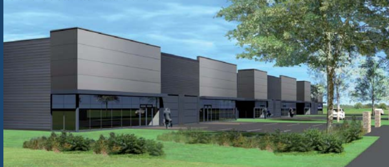
Plan des bâtiments du futur village artisan de la zone d'activités Actival d'Orne II.