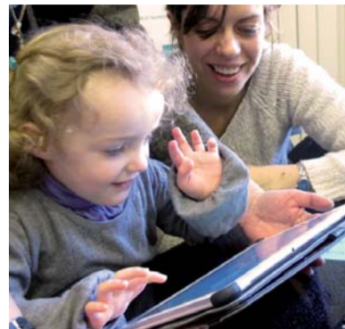
ÉQUIPEMENTS Argentan Intercom au service des tout-petits