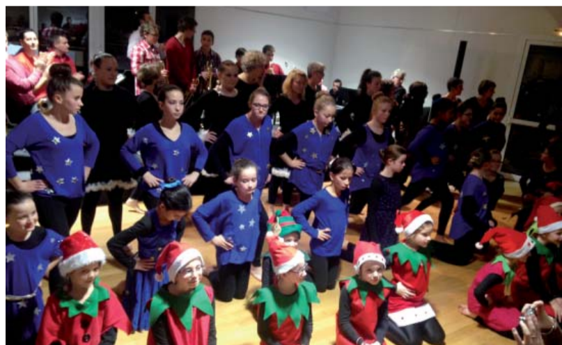
Une mise en commun du travail réalisé en musique et danse a été présentée en décembre aux habitants de Nécy.

◆ Un projet d'établissement fixant les objectifs artistiques et pédagogiques du conservatoire a été rédigé pour la période 2015-2020. Approuvé en bureau communautaire le 3 novembre 2015, ce document développe les trois grands axes retenus pour impulser une nouvelle dynamique à cet équipement.