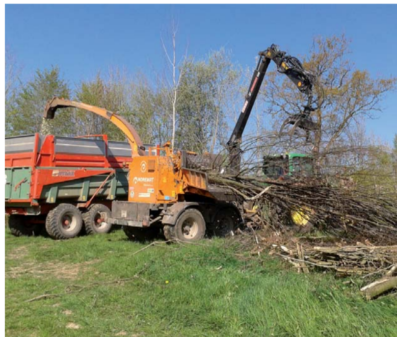
La chaufferie bois est alimentée par le bois issu des haies bocagères.

◆ En lien avec une prévision de travaux sur le groupe scolaire de Trun, des élus et techniciens d'Argentan Intercom et de la ville d'Argentan se sont rendus à Aube (61), ville innovante en matière de chauffage au bois. Cette visite a été organisée dans le cadre du programme de transition énergétique engagé par la communauté de communes et de la Cop21 qui s'est déroulée en décembre dernier. Une magnifique réalisation dont les collectivités devront s'inspirer.