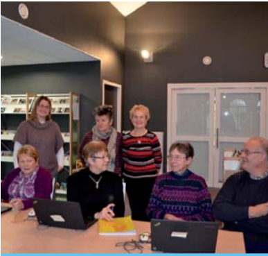
RÉSEAU MÉDIATHÈQUES Trun s'ouvre au numérique