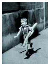
Le «petit Parisien» photographié par Willy Ronis en 1954.

A la médiathèque François Mitterrand. Ouvert de juin à septembre de 10h à 18h30 le mardi et mercredi, de 13h30 à 18h30 le jeudi