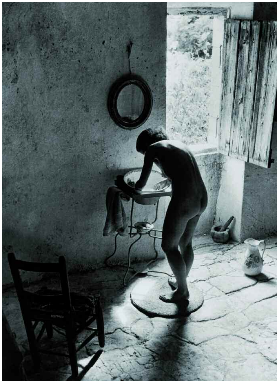
«Le Nu provençal» - Gordes, Vaucluse, 1949.

Du 23 juin au 29 septembre, le photographe français Willy Ronis est l'invité exceptionnel de la médiathèque d'Argentan. En 80 photos, il raconte la vie des gens modestes et du peuple de France.