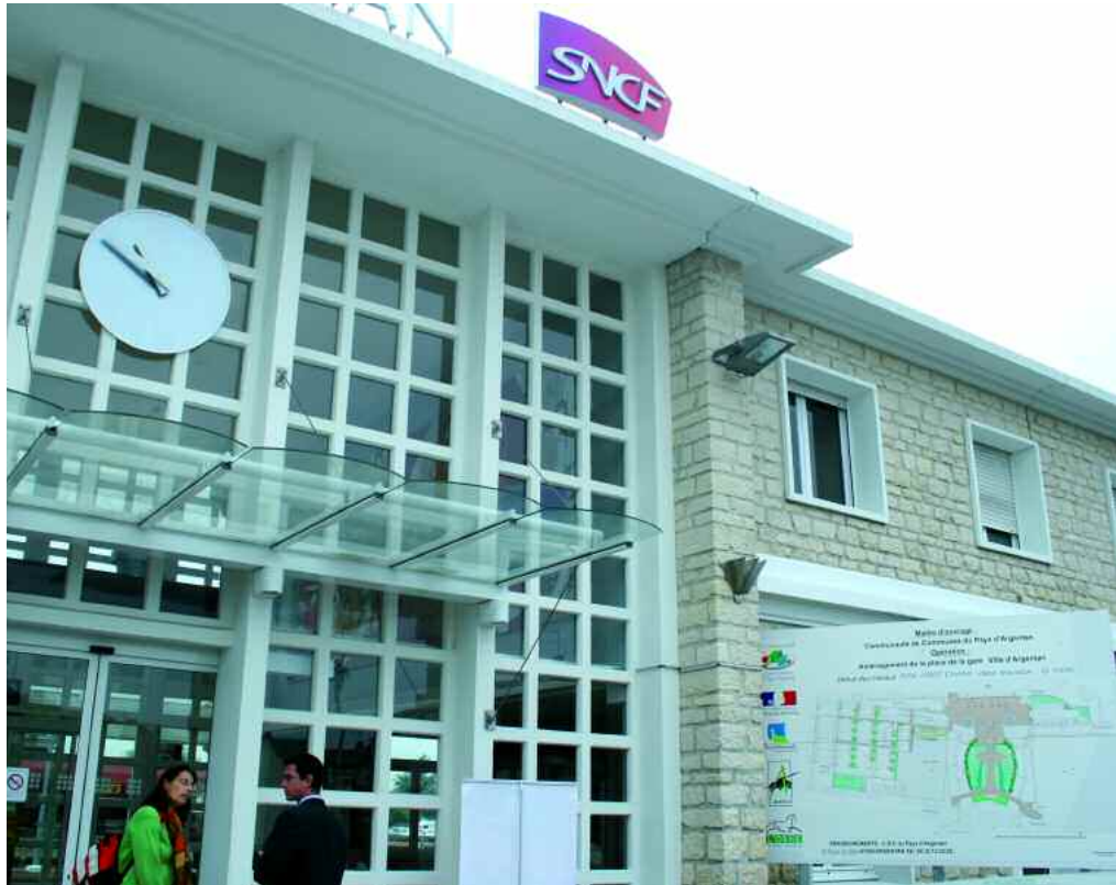
La place de la Gare se prépare à subir un lifting qui va lui donner une allure moderne compatible avec sa fonction d'échange.

Plus loin, la mutation de la place de la gare a débuté. Le coût de cette opération d'envergure s'élève à 1 300 000 euros, financé dans le cadre du Contrat de pôle conclu avec la Région. Les travaux de son réaménagement complet, dont la maîtrise d'ouvrage est assurée par la CDC du Pays d'Argentan, seront achevés cet été : parkings adaptés aux différents temps de stationnement, paysagement, circulation facilitée, nouvelle perspective... « La première impression est souvent la bonne » dit le dicton populaire... L'image de l'arrivée en gare d'Argentan sera améliorée. Pour aménager la place, la solution retenue par les architectes du cabinet "B+H Architectes" épargne les bâtiments voisins... pas les arbres. Mais de nouvelles essences seront replantées le long d'un nouveau cheminement central qui reliera la gare à la ville. Le stationnement a été particulièrement soigné. Les usagers qui doivent laisser longtemps leur véhicule profiteront, d'ici quelques semaines, d'un parking de 100