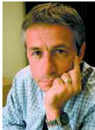
LAURENT BEAUVAIS PRÉSIDENT DE LA COMMUNAUTÉ DE COMMUNES DU PAYS D'ARGENTAN