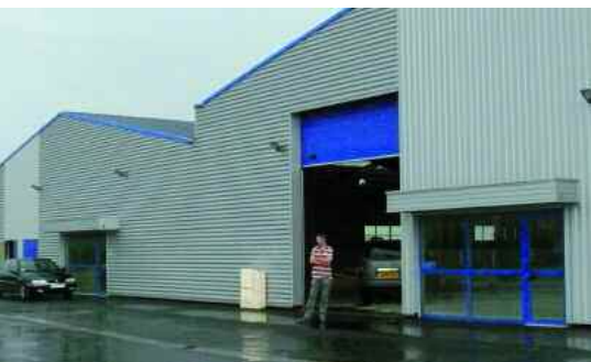
Le second local de Strate Composites, situé sur la zone de l'Expansion, ne sera utilisé que partiellement. Une douzaine de salariés intégreront ces locaux à la rentrée, sitôt les travaux terminés.

Strate Composites a l'avantage de ne pas faire cavalier seul. Elle appartient au groupe PR, basé à Cholet. Celui-ci comprend, une société de création et cinq sociétés de production dont deux en Normandie, l'autre étant implantée à Honfleur et les trois autres à Cholet. « En cas de coup dur, il peut y avoir une répartition de la charge de travail ». La société de création conçoit des prototypes et constitue un vivier de commandes. « Dans le groupe, il y a également une stratégie de développement de nos propres produits, pour du mobilier urbain ou autre ». Pour l'instant cette solution n'a pas vraiment été exploitée par manque de temps. Un bon signe.