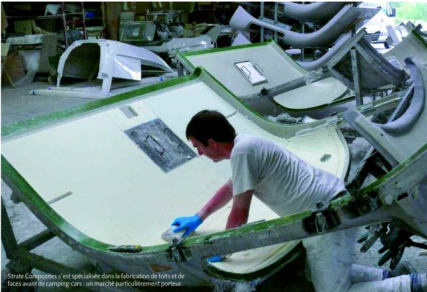
Strate Composites s'est spécialisée dans la fabrication de toits et de faces avant de camping-cars : un marché particulièrement porteur.

Loin des grandes entreprises qui ont marqué le tissu économique local, Strate Composites reste cependant une héritière du passé industriel, avec une particularité : elle crée des emplois en nombre.