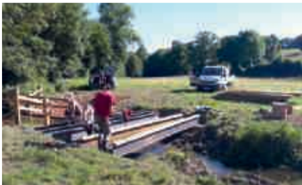
Chaque année, de nouveaux aménagements permettent de mieux intégrer les rivières.

« Mais la communauté de communes n'a pas autorité sur les propriétaires pour engager ces nouveaux aménagements. Cela passe par l'information, l'incitation et la force de l'exemplarité. » Cette force de l'exemplarité, c'est notamment la signature par Argentan Intercom d'un contrat territorial Eau-Climat avec l'Agence de l'Eau Seine-Normandie sur un programme d'actions en trois ans qui va permettre par exemple de reconstruire la station d'épuration de Rânes qui ne correspond plus aux normes écologiques souhaitables. Pour maintenir un patrimoine aquatique qui souligne le caractère du territoire, mais aussi préserver la ressource en eau indispensable à la santé et au bien-être de ses habitants, la communauté de communes Argentan Intercom n'a pas l'intention de se la couler douce. Car c'est d'évidence, un des enjeux majeurs des prochaines années pour une collectivité qui affiche la volonté d'être exemplaire dans sa politique de développement durable.