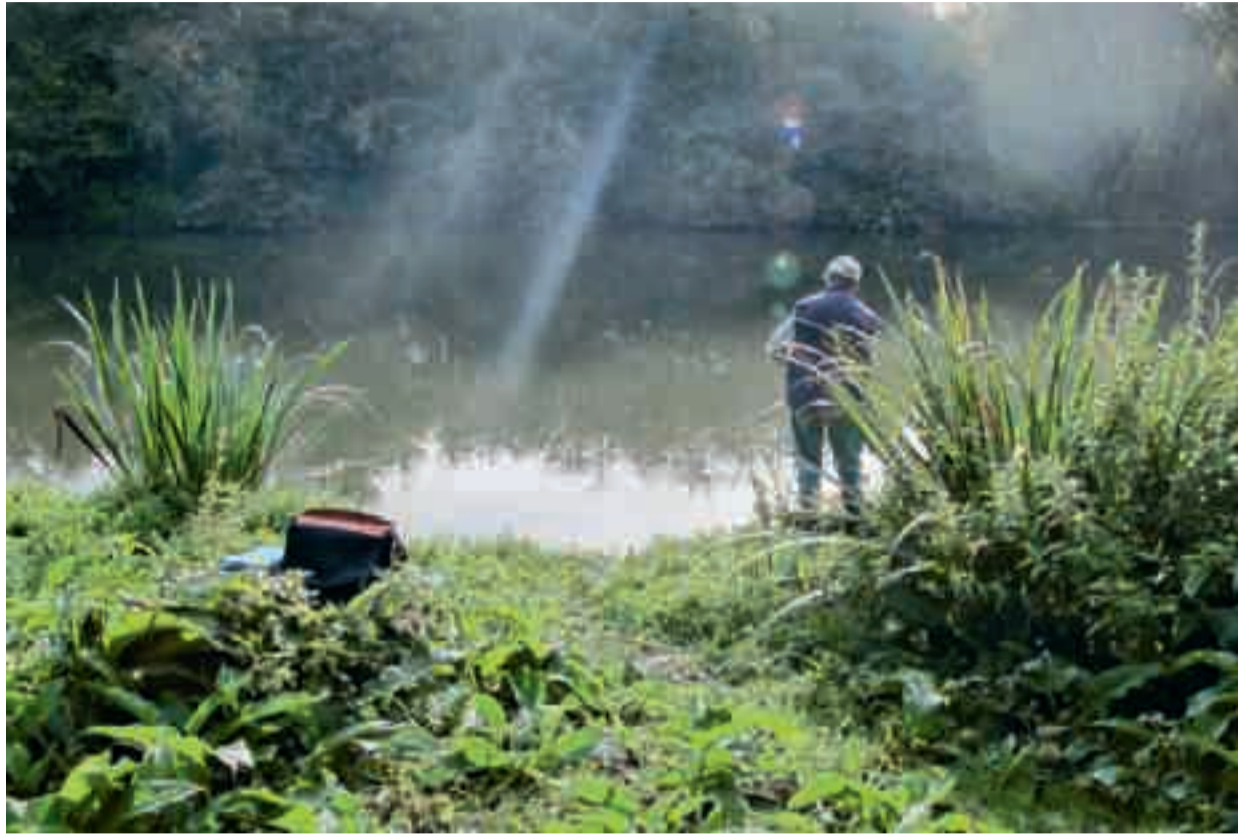
Nos rivières, un patrimoine aquatique qui participe au sentiment de bien-être.