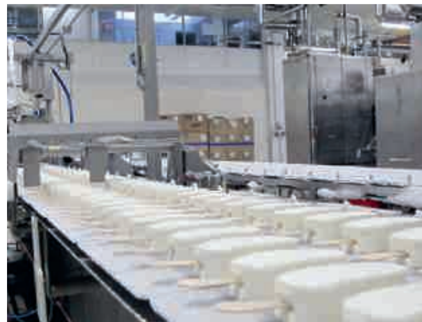
Sur la ligne de production des glaces en bâtonnets, fleuron de la technologie de l'usine Ysco.

Bacs à glace, cônes, bâtonnets, petits pots, desserts à partager, rien n'échappe à Ysco capable de s'adapter en permanence aux nouvelles tendances comme aux habitudes des différents marchés européens. Même pour