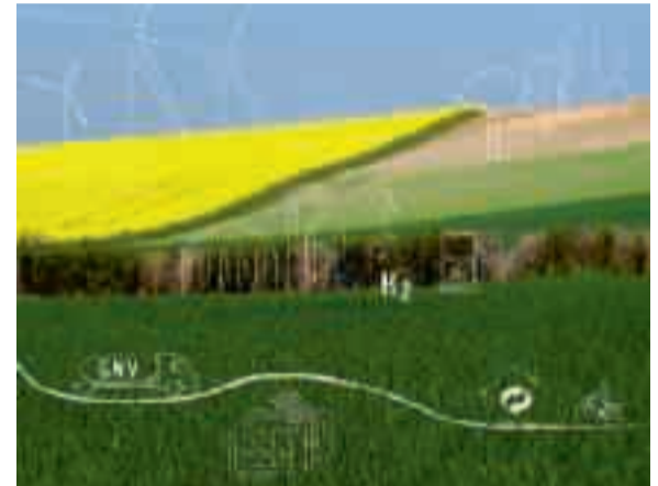
Un mix énergétique en cohérence avec nos paysages et nos valeurs.