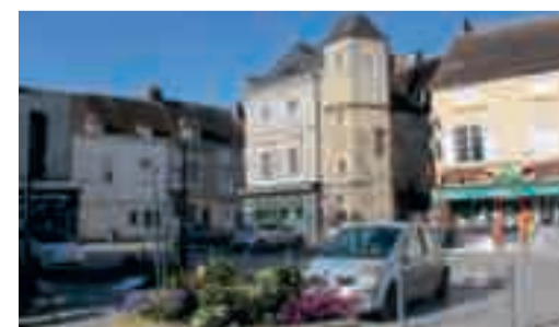
Le centre-ville d'Écouché-les-Vallées.

Bonne nouvelle pour les habitants des communes de Trun et d'Écouché-les-Vallées, toutes deux retenues pour bénéficier du dispositif « Petites Villes de Demain » porté par le Ministère de la Cohésion Territoriale en partenariat avec les collectivités locales. A l'instar du programme « Action Cœur de Ville » dont Argentan bénéficie, les objectifs de « Petites Villes de Demain » visent à revitaliser les centres-bourgs de Trun et d'Écouché-les-Vallées sur les six prochaines années dans les domaines du commerce, du logement, du développement durable, des services publics, de l'accès à la culture, à la santé, à l'éducation ou aux nouvelles technologies... Pour nos deux communes qui constituent les pôles secondaires de la communauté de communes après la ville-centre d'Argentan, il s'agit de s'affirmer au sein d'une cohérence territoriale souhaitée par l'ensemble des élus d'Argentan Intercom. Pour relever ce défi, elles vont bénéficier d'un soutien technique et d'une expertise des nombreux partenaires du programme, d'une mise en réseau avec les mille communes françaises retenues et d'aides financières pour la concrétisation de leurs projets.